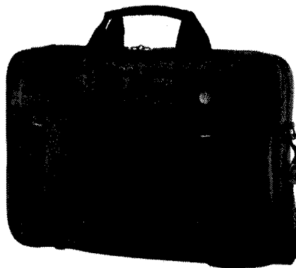
Figura 2 Imagine orientativă geantă laptop